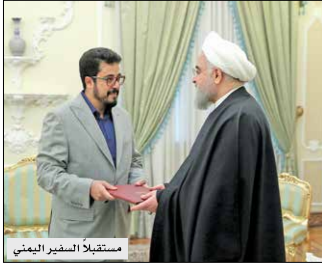
مستقبلاً السفير اليمني

الله إلى الحكومة والشعب الإيرانيين، داعياً إلى مزيد من تطوير وتعزيز التعاون الثنائي. وقال السفير اليمني الجديد: إن الشعب اليمني لن ينسى أبداً المواقف المشرفة والقوية والقيمة للحكومة الإيرانية والشعب الإيراني دعماً للثورة اليمنية، مضيفاً: إن إيران حكومة وشعباً كانت أفضل صديق ورفيق للشعب اليمني، وفي الوقت الذي كان الشعب اليمني تحت ضغوط العقوبات والعدوان، فإن الجمهورية الإسلامية الإيرانية كانت الوحيدة التي دعمت الشعب اليمني ووقفت إلى جانبه وستواصل القيام بذلك.