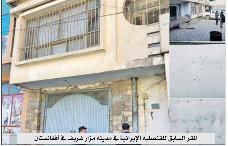
المقر السابق للقنصلية الإيرانية في مدينة مزار شريف في أفغانستان

• دماء الشهداء تلقي مسؤولية جسيمة علما عاتقنا.. نتعلم الحاح المستقبل ولا ننسح الماضي أبداً