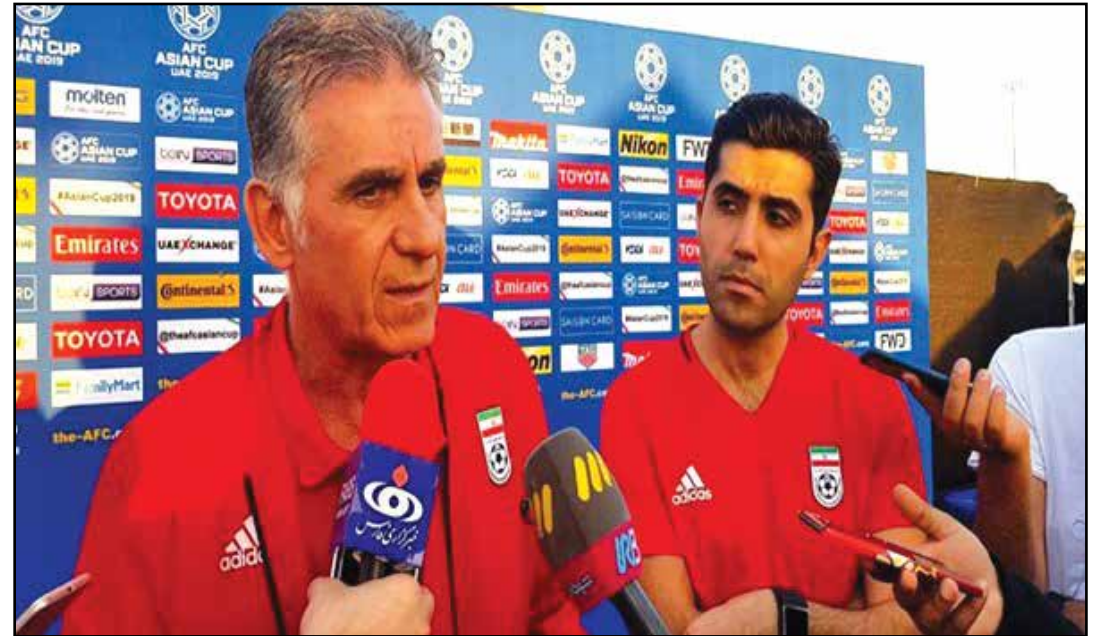
قال مدرب المنتخب الوطني الإيراني لكرة القدم البرتغالي «كارلوس كيروش» انه يريد تحقيق نهاية جيدة السبت في الامارات.

يذكر أن إيران تخوض مبارياتها في بطولة كأس أمم آسيا في المجموعة الرابعة إلى جانب اليمن وفيتنام والعراق، وستكون أولى مبارياتها أمام اليمن يوم الاثنين القادم.