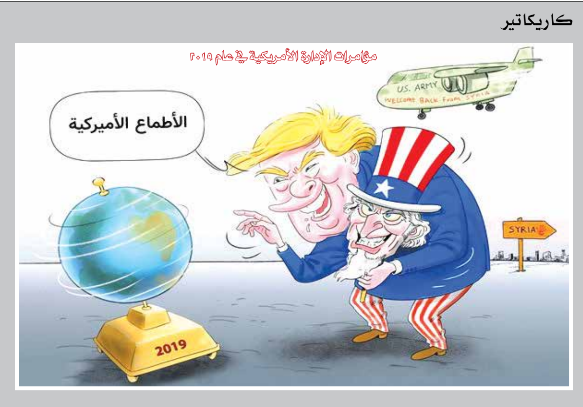
مخيمات اللاجئين الأمريكية في عام ٢٠١٩

«الوفاق» صحيفة يومية «سياسية-اقتصادية-اجتماعية» تصدر عن وكالة الجمهورية الإسلامية الإيرانية للأنباء «إرنا» المدير المسؤول ورئيس التحرير: مصيب نعيمة العنوان: طهران، شارع خرمشهر - رقم ٢٠٨ الهاتف: ٠٥ +٩٨٢١/٨٨٧٥١٨٠٢ - ٠٧ +٩٨٢١/٨٤٧١٢٠٧ الفاكس: ٠٥ +٩٨٢١/٨٨٧٦١٨١٣ - ٠٧ +٩٨٢١/٨٤٧٥٠٣٨٨ الإشتراكات: ٠٥ +٩٨٢١/٨٨٧٤٨٨٠٠ الإنتشارات: ٠٥ +٩٨٢١/٨٨٥٤٨٨٩٥ و ٠٥ +٩٨٢١/٨٨٥٤٨٨٩٥ مكتب الوفاق بيروت-لبنان: ٠١ - ١٨٤٣١٤٥ - ٩٦١/١٨٤٣١٤٧ عنوان «الوفاق» على الإنترنت: www.al-vefagh.com البريد الإلكتروني: al-vefagh@al-vefagh.com