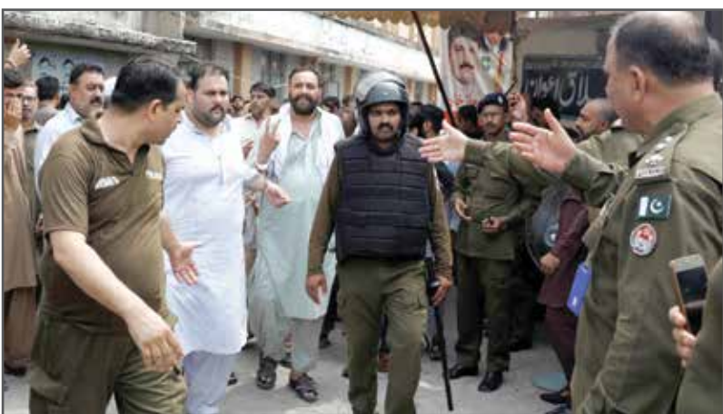
الشرطة تعتقل حلفاء رئيس الوزراء السابق المتهم بالفساد

يخططون لتنظيم مسيرات إلى المطار لاستقبال زعيمهم، وذكرت قناة إخبارية أن السلطات الفت القبض أيضا على أعضاء منتخبين من المجالس المحلية للحزب في عمليات مدمرة لثلاثتهم. كما أُلغيت الإدارة المحلية جميع الطرق المؤدية إلى المطار للتصدي لأنصار شريف خوفا من التجمع لمنع الشرطة من إلقاء القبض على الزعيم السابق. وكانت إحدى المحاكم المعنية بالنظر في قضايا الكسب غير المشروع قد حكمت على شريف وابنته بالسجن عشر وثماني سنوات (على التوالي) الأسبوع الماضي بتهم فساد. ويوم صدور الحكم، قال شريف إنه سيقدر لندن حيث يقام هناك بشكل مؤقت منذ ٢٠١٧. وأضاف في مؤتمر صحفي «لن أكون عبداً لأولئك الذين ينتهكون قسمهم ودستور باكستان (في إشارة إلى القضاة الذين حكموا عليه بالسجن).