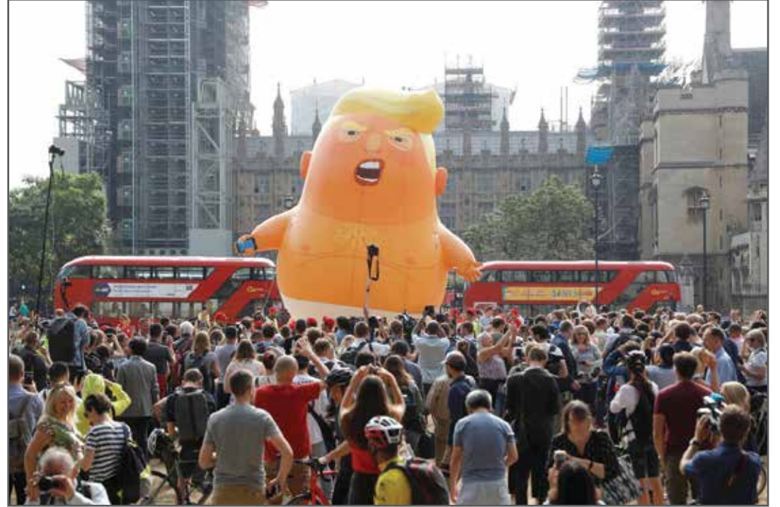
أطلق محتجون في سماء لندن بالوناً يصور ترامب كضلع رضيع

ويعلق غير اعتيادي على السياسة البريطانية، قال ترامب أيضاً إن وزير الخارجية البريطاني السابق بوريس جونسون، الذي استقال هذا الأسبوع بسبب خطة رئيسة الوزراء لبريكست وينظر إليه على أنه منافس محتمل لتيريزا ماي، سيكون «رئيس حكومة عظيماً» إذا ما تلقى الدعم الكافي من حزب المحافظين الذي تنتمي إليه ماي. يشار إلى أنه بعد عامين من الخلافات منذ صوت البريطانيون لصالح مغادرة الاتحاد الأوروبي في استفتاء عام ٢٠١٦، وافقت الحكومة البريطانية الجمعة الماضية على خطة «مؤيدة للأعمال» طرحتها ماي للانسحاب من شأنها أن تبقى بريطانيا في منطقة تجارة حرة للسلع مع الاتحاد