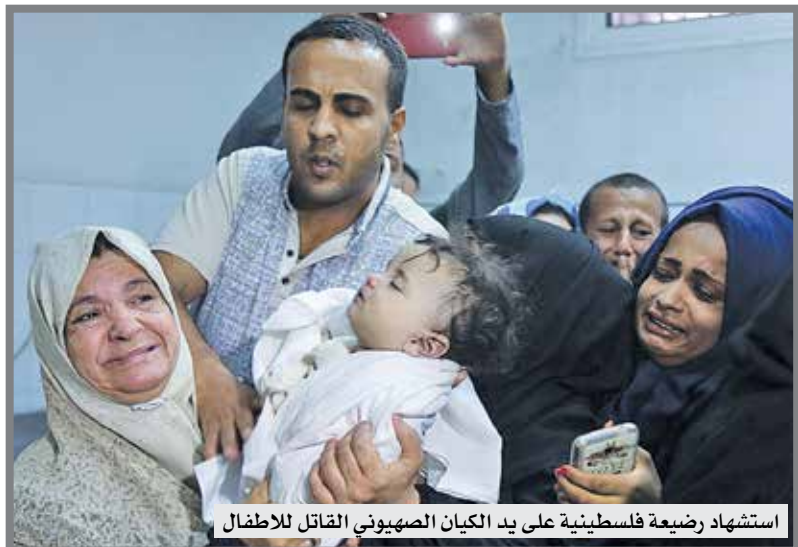
استشهاد رضية فلسطينية على يد الكيان الصهيوني القاتل للاطفال

من الضفة الغربية في الذكرى السبعين للنكبة. وأطلقت قوات الاحتلال الاسرائيلي الرصاص الحي وقنابل الغاز على الفلسطينيين في المدخل الشمالي لهذه المدينة.